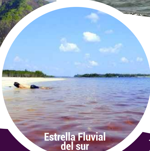
Estrella Fluvial del sur